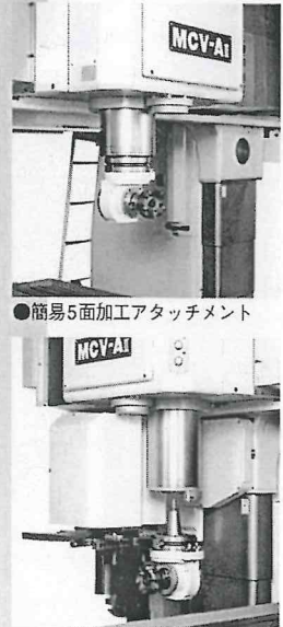
●簡易5面加工アタッチメント